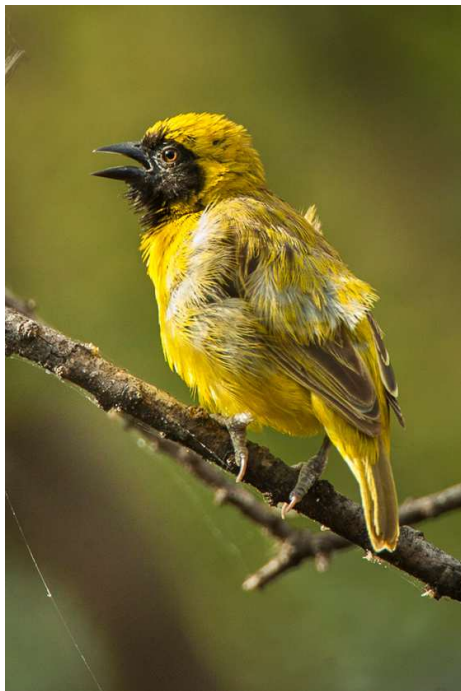
Törpe álarcos szövő

A tojó fakó olajzöld és a költési időszakon kívül a hím is ilyen. Hazája Északkelet- és Északnyugat-Afrika. Művészi fészke tojás alakú, oldalt lefelé irányuló bebújónyílással. Átlátszó, de erős alkotmány. A ritkábban importált szövőmadarak közé tartozik. Téli tollzatában nyugodt, békés madár, kiszíneződve azonban igazi szövő természetű van, izgatott, veszekedős. Fészke közelében a nála jóval nagyobb madarakat is megtámadja. A nászruhás hím rövid idő alatt több fészket sző. Tojásainak száma 2-3, színük tiszta fehér. A kotlási idő 11 nap, a szülők felváltva ülnek, fiókáikat is mindketten etetik. Egymás után több költés lehetséges. Könnyen, de nem megbízhatóan költ.