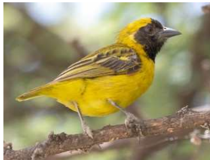
Törpe álarcos szövő

Apám volierjében két pár törpe álarcos szövő egy pár indiai szövőmadárral, egy pár vörösfejű szövőmadárral volt együtt. Többször költöttek, a fiókák azonban 6-7 napos korukban mindig elpusztultak. Ennek valószínűleg az volt az oka, hogy a szülők csak hatnapos korukig takarták éjjel is fiaikat, s a nálunk elég gyakori éjjeli lehülések miatt a fiókák reggelre egyszerűen kihültek. Más hazai tenyésztő is tapasztalta később ugyanezt.